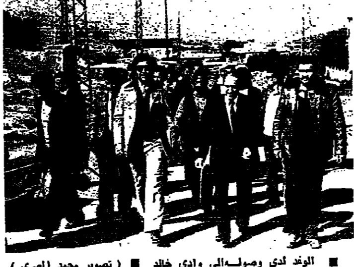
الوفد لدى وصوله الى وادي خالد

قطع التيار الكهربائي عن طرابلس الاحد المقبل بسبب افعال الصيغة على شبكة الخطوط الكهربائية الرئيسية المغذية لحيطة طرابلس . تعان شركة كهرباء قايشا ، انها مضطرة لقطع الجرى الكهربائي عن مدينة طرابلس بكاملها . اليخصاص - البداوي - البنية بكاملها - قريه السوار . وذلك يوم الاحد الواقع في ١٦-١١-٧٧ من الساعة التاسعة صباحا ولفيلة الساعة الرابعة عشرة .